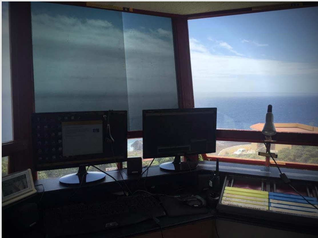
Capturas cedidas por Sergio Rodríguez (La Palma Torre)